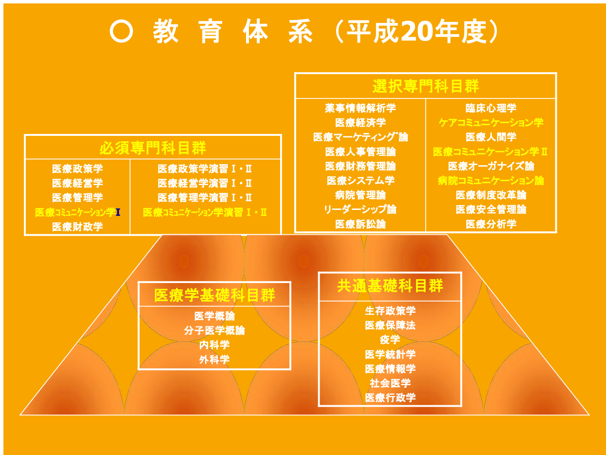
図4 講座の教育体系

になり、その上に必須および選択専門科目群を学ぶことになる。卒業要件は卒業成果物（修士論文）を除いて30単位以上である。