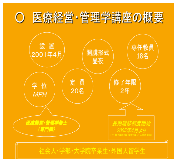
図1 医療経営・管理学講座の概要

対象は社会人・学士・大学院生・外国人留学生である。終了時に医療経営・管理学修士（専門職）が与えられる。修了年限は2年間であるが、2005年から3年間の長期履修制度が導入された。開講形式は原則的に昼間であるが、一部の授業は夜間にも開講している。